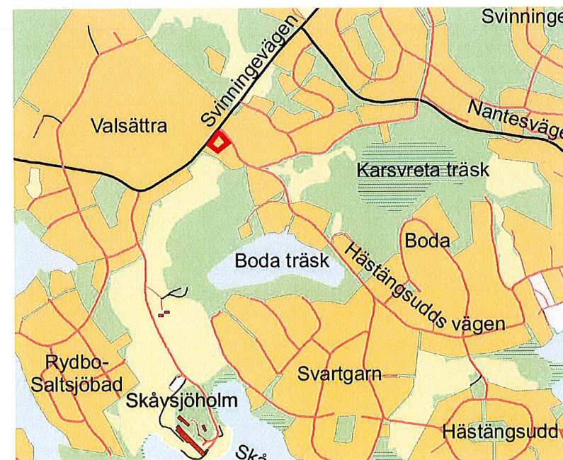
Orienteringsbild med planområdet markerat med röd linje