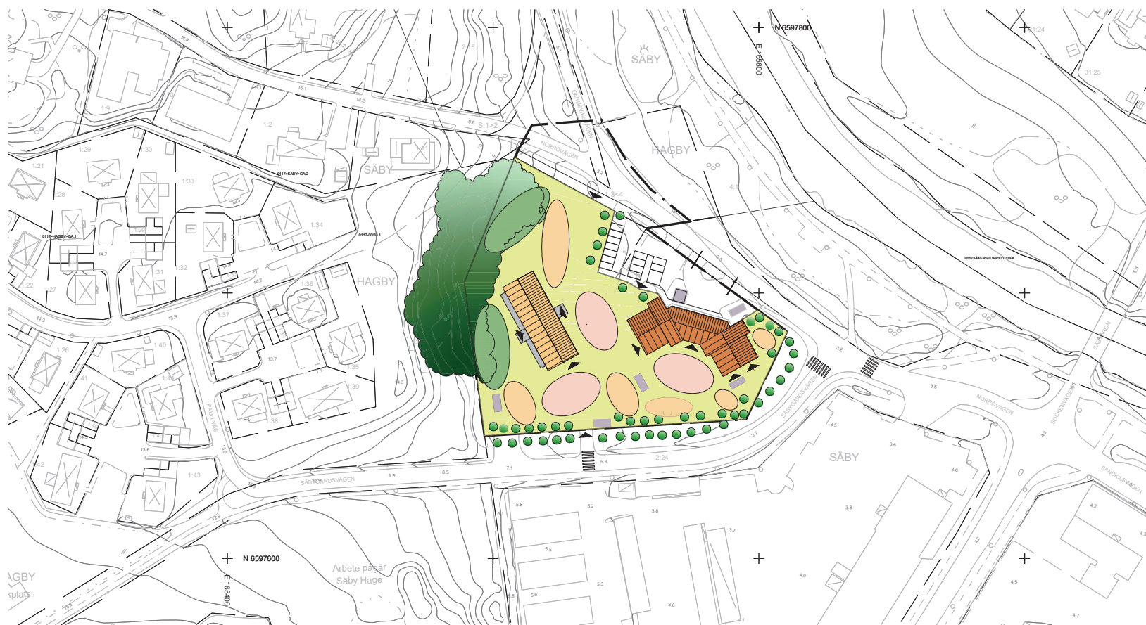
ILLUSTRATION (Illustrationen visar ett förslag på placering/utformning).