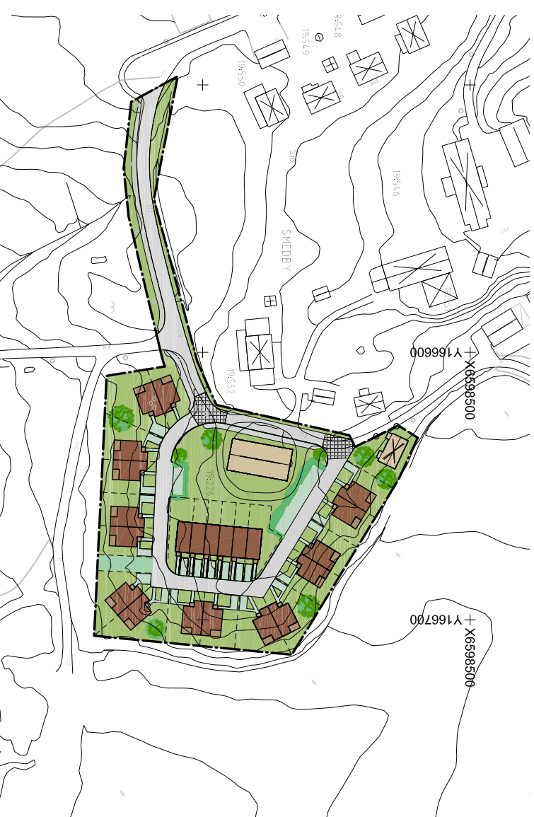
ILLUSTRATION MED FØRESLAGNA TOMTGRÆNSER