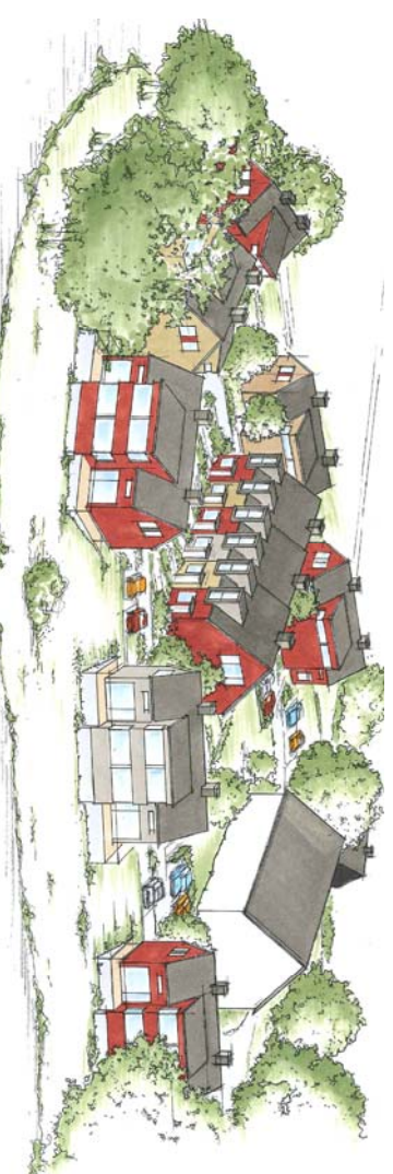
FØRSLAG PÅ UTFORMNING - OMRÆDE SETT NORRFRAN