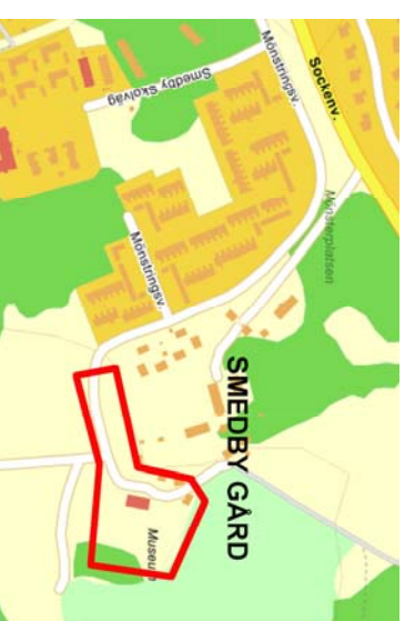
KARTBILD AV PLANKARÆDET CA 2 KM NORR OM AKERSBERGA CENTRUM