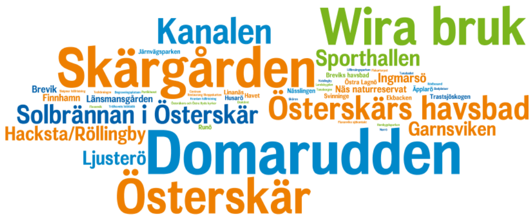
Figur 3. Ordmoln visande platser i Österåker medborgare visar sina besökare.