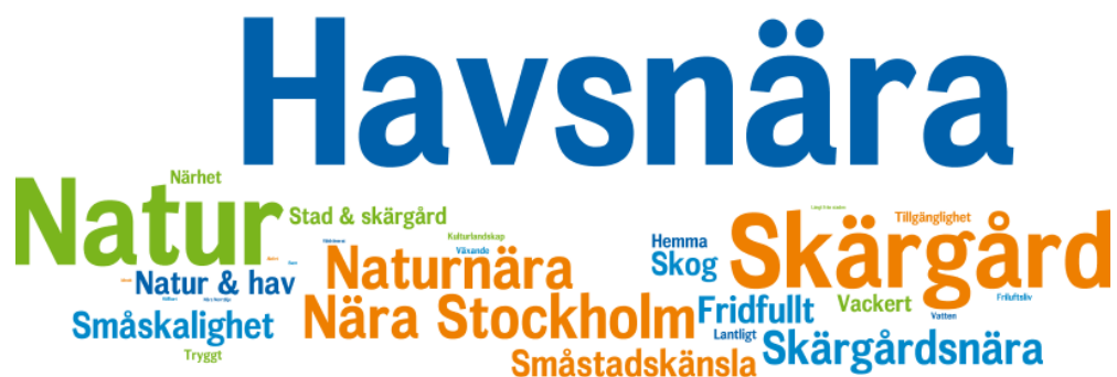
Figur 1. Ordmoln visande Österåkers identitet idag och i framtiden

När det kommer till Österåkers identitet har synpunkterna handlat om den identiteten medborgarna upplever idag och den identiteten de vill att kommunen utvecklar i framtiden. Den absolut vanligaste identiteten som tagits upp har varit havsnära. Österåker har en lång kuststräcka och stor skärgård och närheten till vattnet är något som många förknippar kommunen med. Just närhet har kommit upp i andra sammanhang under temat identitet, då även naturnära och närhet till Stockholm har kommit upp som identiteter. Olika identiteter förknippade med natur har varit återkommande. Skärgård, natur, skog och hav har alla varit i topp bland identitetsorden som tagits upp. Andra typer av identiteter i kommunen så som småskalighet och småstadskänsla har också kommit fram under medborgardialogen. Utöver dessa har även fridfullt, hemma och vackert varit återkommande för att beskriva kommunens karaktär.