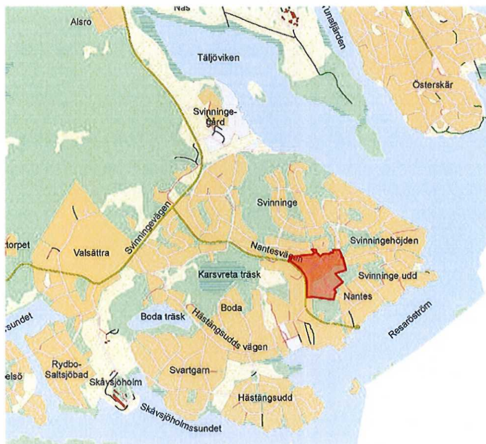
Orienteringskarta, planområdet markerat som rött.