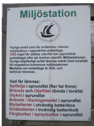
Figur 6. Förteckning över avfall som tas emot på Säbyvikens marinas miljöstation. Till denna lista tillkommer även elavfall.

Fritidsbåtshamnen ska ansvara för att informera de som använder hamnen om hur avfall tas emot och vilka mottagningsanordningar som finns. Det framgår av Sjöfartsverkets föreskrift (SJÖFS 2001:13). Vad informationen ska innehålla och hur Säbyvikens marina hanterar detta framgår av Tabell 2 .