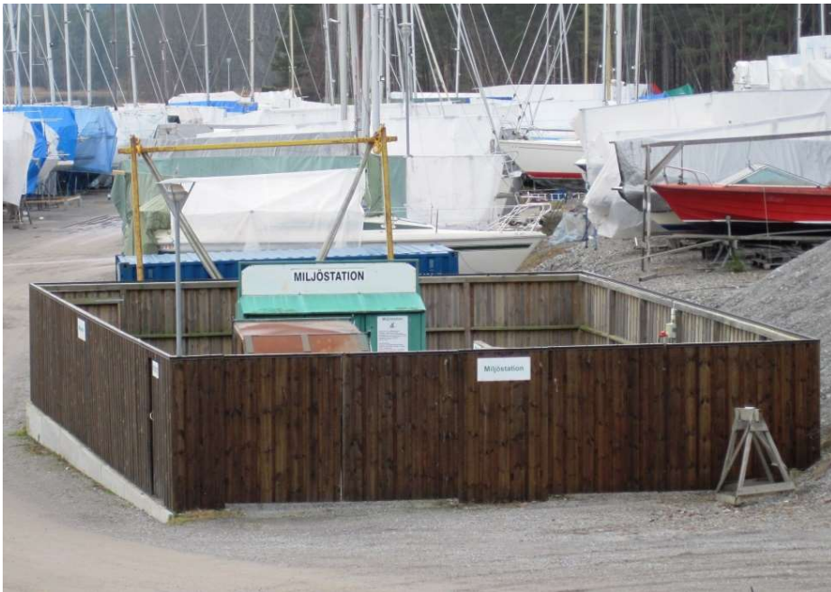
Figur 3. Marinans miljöstation.

På miljöstationen finns idag möjlighet att lämna hushållsavfall, farligt avfall, startbatterier, småbatterier och elavfall. Farligt avfall såsom spilloljor och lösningsmedel lämnas i en mottagningsanordning med invallning hantering av eventuellt spill, se Figur 4.