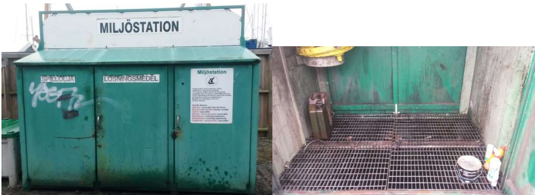
Figur 4. Mottagningsanordning för spilloljor och lösningsmedel.

På miljöstationen finns idag möjlighet att lämna hushållsavfall, farligt avfall, startbatterier, småbatterier och elavfall. Farligt avfall såsom spilloljor och lösningsmedel lämnas i en mottagningsanordning med invallning hantering av eventuellt spill, se Figur 4.