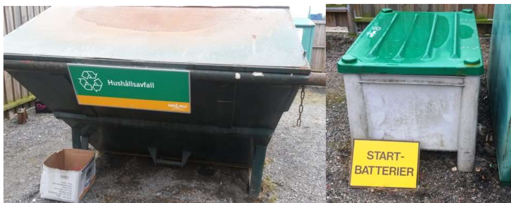
Figur 5. Container för hushållsavfall och behållare för startbatterier.