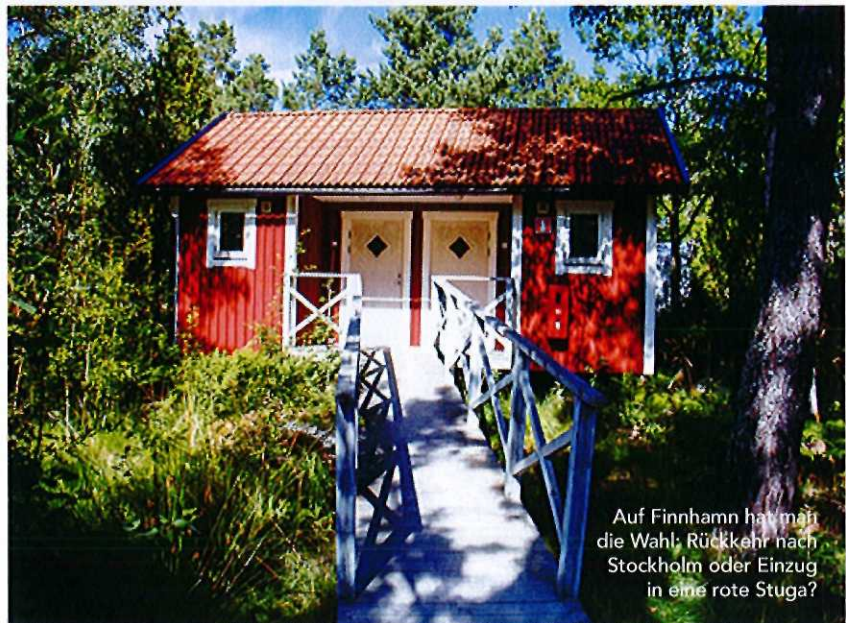
Auf Finnhamn hat man die Wahl: Rückkehr nach Stockholm oder Einzug in eine rote Stuga?

Utö – das ist die Insel, auf der Jachtbesitzer die Sommernächte durchfeiern und Outdoorliebhaber das Naturreiservat durchstreifen. Utö ist bekannt für seine Geologie: Der Kalkstein erinnert an Gotland, und 1817 wurde auf der Insel von Johan August Arfwedson erstmals das heute in Akkus verwendete Alkalimetall Lithium entdeckt. Es geht vorbei an ehemaligen Eisenerzminen und einer Windmühle mit Aussicht. Mitten im Wald lädt »Matssons kök« zu einer Stärkung ein. Hüfthoher Farn, üppige Heide, lila-gelber Hain-Wachtelweizen im Überfluss und Springkraut fast auf Augenhöhe machen die Wander- oder Radtour nach Ålö zu