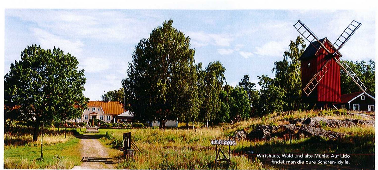
Wirtshaus, Wald und alte Mühle: Auf Lidö findet man die pure Schären-Idylle.

wagen sich Kajak-Freunde die zerfurchte Küste entlang, während sich Hochzeitspaare auf einer Lichtung am Wasser ewige Treue versprechen. Durch den urigen Wald schlängelt sich ein Wanderweg mit kleinen Brücken und schiefen Treppen, auf dem man sich ganz alleine fühlt – bis ein Fuchschädel auf dem Moos leuchtet. Dabei gab es auf der Insel eigentlich eine ganz andere Art von Pelztieren: In der Zwischenkriegszeit beherbergte das heutige Gasthaus Europas größte Nerzfarm. Als im Krieg Futter und Bedarf versiegten, kaufte die Stadt Stockholm die Insel und machte sie zum Erholungsort für erschöpfte Hausfrauen. So klein Lidö auch ist – in seine Geschichte schrieben sich weit gereiste Seefahrer, ein russischer Zar und nicht zuletzt zwei tüchtige Unternehmer ein. 1634 ließ sich der in Jena ausgebildete Diplomat Bengt Oxenstierna – Cousin des schwedischen Reichskanzlers Axel Oxenstierna – ein Schloss errichten. Im Auftrag des Königs war er, übrigens als erster Schwede nach den Wikingern, bis nach Indien gereist. Doch sein Anwesen überdauerte keine hundert Jahre. Im Sommer 1719 wollte der russische Zar im Großen Nordischen Krieg die Macht über die Ostsee an sich reißen, indem er die Gebäude auf den Schären niederbrennen