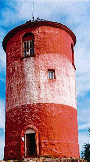
Die markante Bake verrät die Insel Arholma von Weitem.