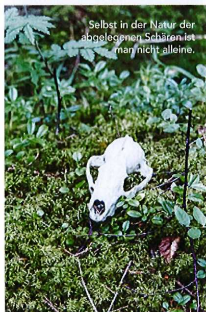
Selbst in der Natur der abgelegenen Schären ist man nicht alleine.

einem Streifzug durch die nordische Flora. Auf Ålö, am südlichsten Zipfel der Inselgruppe, wartet ein Strand, für den allein sich die Reise lohnt: Feiner Sand, Felsen zum Verweilen und eine Bucht, die sich selbstbewusst ins offene Meer wölbt. Wer dort ein Zelt hat, ist der glücklichste Mensch. Er sieht nicht nur den Sonnenaufgang über dem offenen Meer am nächsten Morgen, sondern in der Abgeschiedenheit auch die Milchstraße. Die unzähligen Sterne scheinen ein Spiegelbild der Schären zu sein. Spätestens dann kommt das Gefühl auf, eins zu sein mit dem Universum – das Gefühl, für das wir reisen. ■