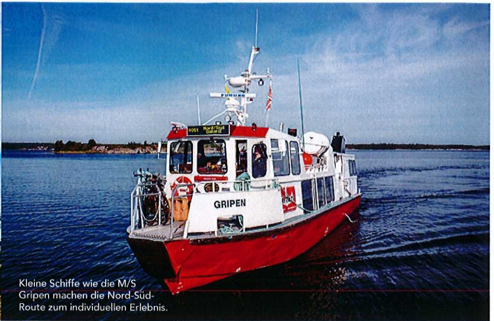
Kleine Schiffe wie die M/S Gripen machen die Nord-Süd-Route zum individuellen Erlebnis.

zen zu teuer war, behielt man in diesem Wettkampf gerne für sich.