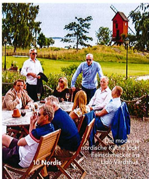
Die moderne nordische Küche lockt Feinschmecker ins Lidö Vardshus