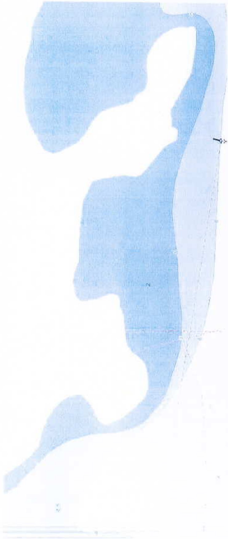
Kartor, vägbeskrivningar, flygfoton, sjökort & mycket mer på entro.se Svermarkipp Ökart: 2013-05-06; 17:58