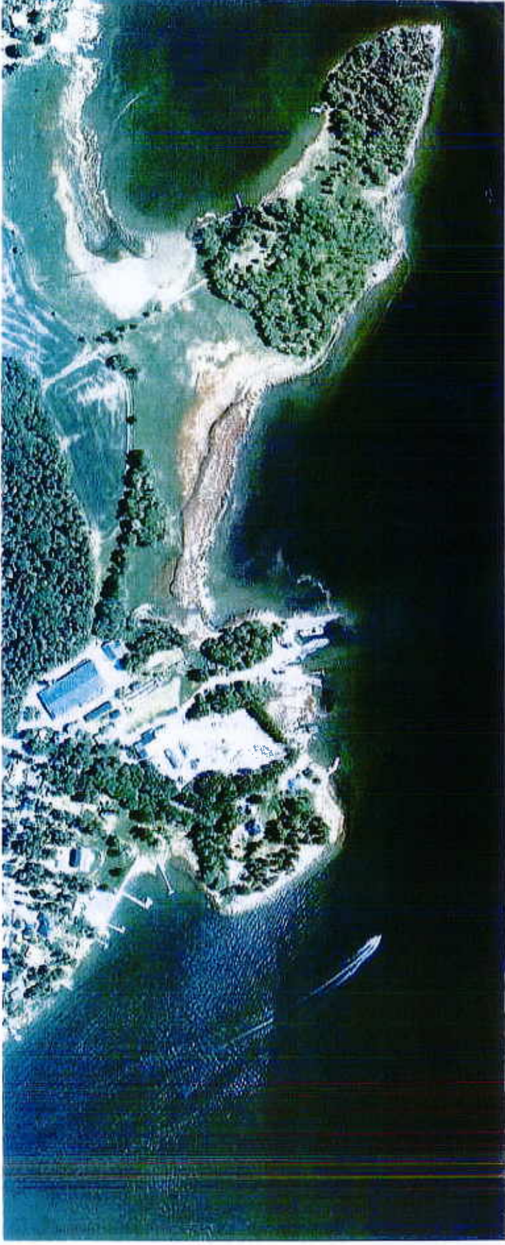
Kartor, väghesnivningar, flygfoton, sökkort & mycket mer på eniro.se Skärmurklipp gjort: 2013-05-06; 17:59