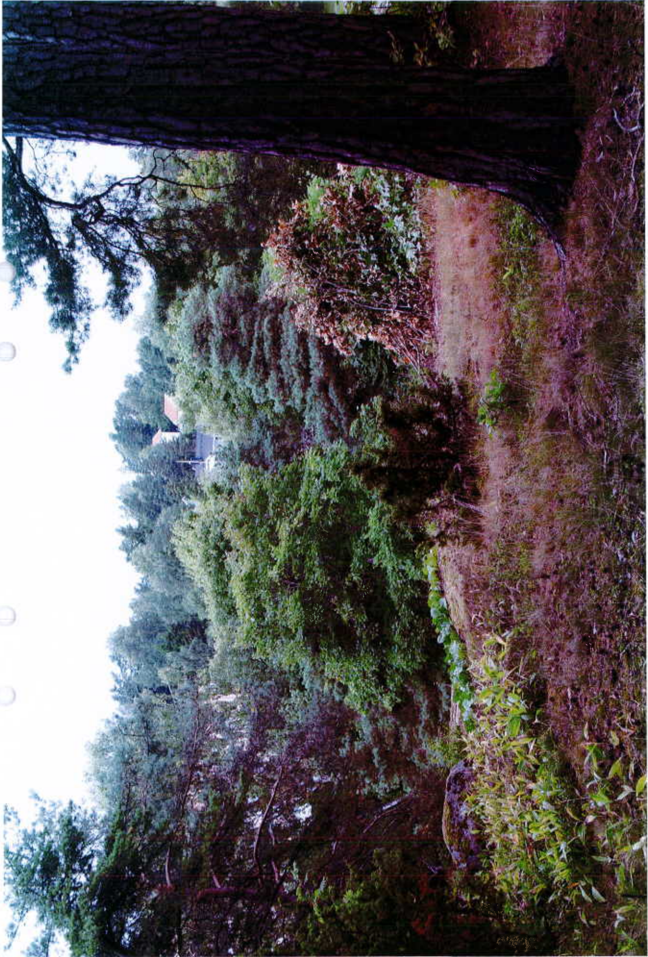
Utsikt från Berga 11:1 år 2013