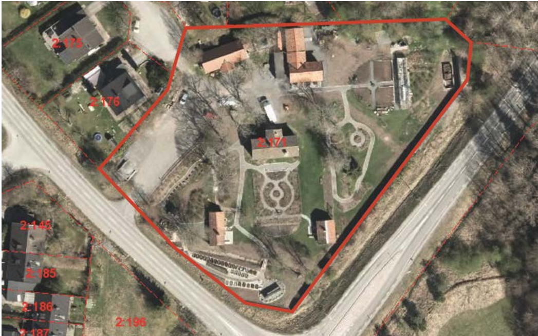
Figur 2. Skånsta 2:171