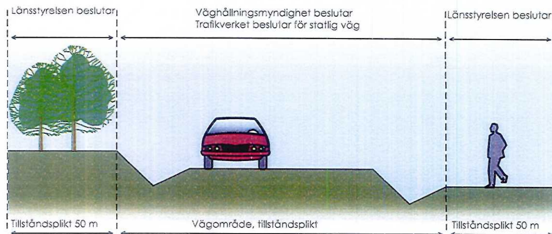
Illustration utanför detaljplanerat område