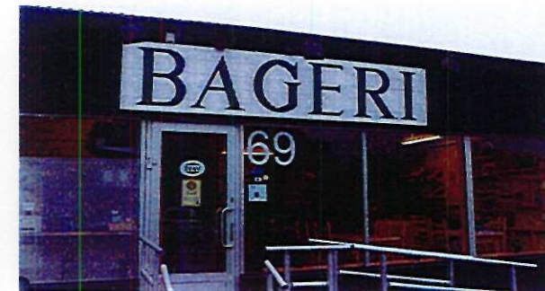
Exempel på planskyt