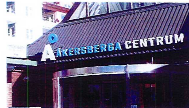
Exempel på friliggande bokstäver

Liknar planskytten men är en låda, med inbyggd armatur. Den är svår att anpassa till byggnadernas arkitektur och är lämplig i storskaliga miljöer. Stora lysande ytor bör undvikas och det är texten som ska vara lysande och inte bakgrunden. Karaktären av låda förstärks av ljus bakgrund och skyltlådor för lysrör godkänns i regel bara i handels- och industriområden.