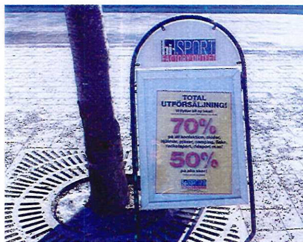
Exempel på vippskytt

Så kallad trottoarpratare är utplacerad på trottoarer eller torg, med syfte att framföra butiks- eller restaurangreklam. Den allmänna tillgängligheten kan störas då denna typ av skylt ofta orsakar problem för synskadade och andra funktionshindrade samt för renhållningsfordon. Vippskyttar får endast placeras i direkt anslutning till verksamheten, ska plockas bort över natten och kräver markägarens tillstånd.