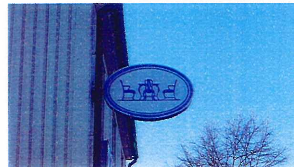
Exempel på utstående skylt