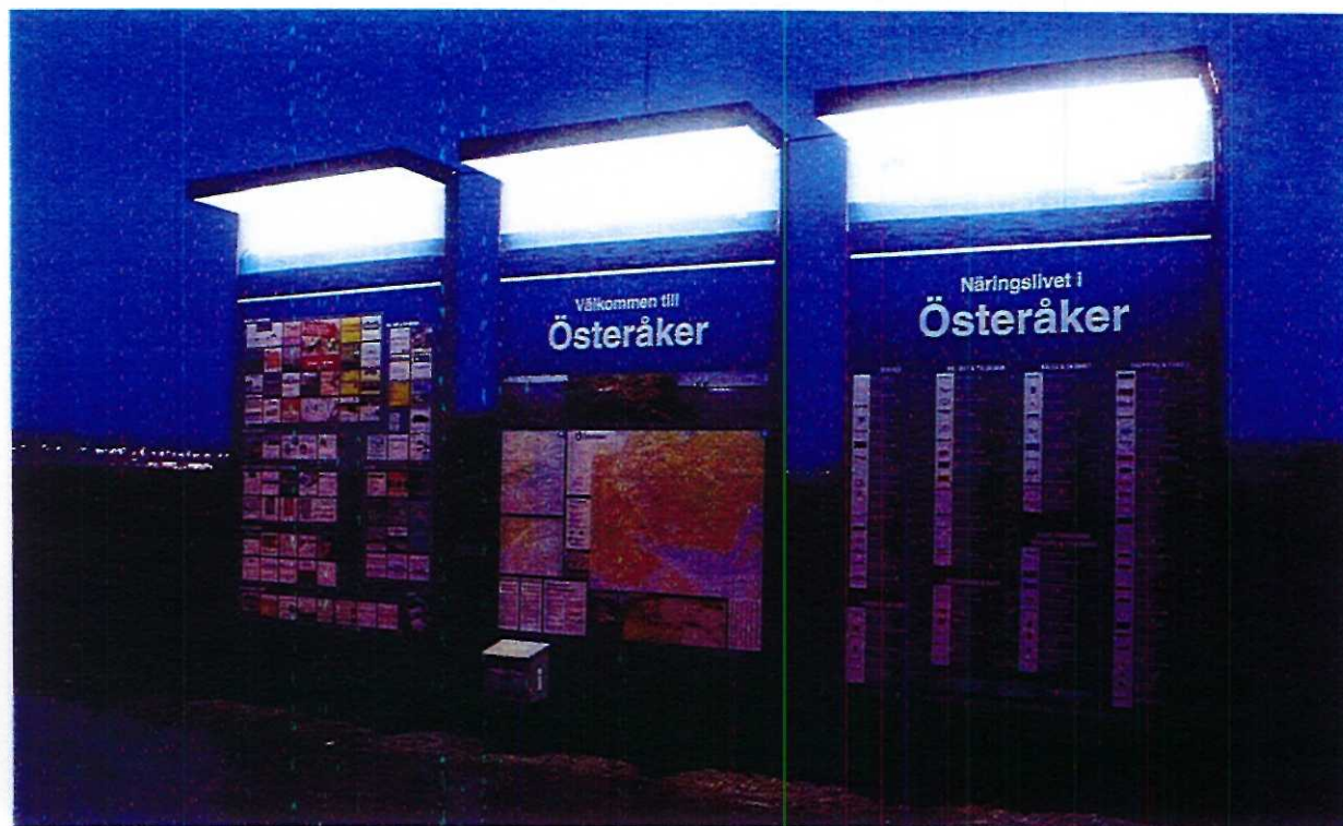
Foto informationsskylt Österåkers kommun

Att skyltar placeras i exponerade lägen kan vara en förutsättning för detta och genom tillämpning av skyltpolicyns riktlinjer ska företag och andra