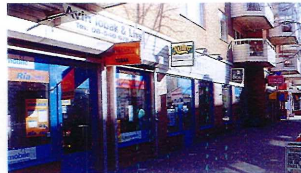
Exempel på utstående skylt