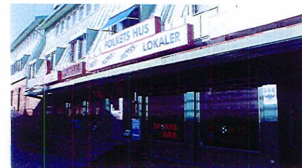
Exempel på skytflåda