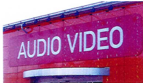
Exempel på skivskylt

Vanlig som butik- och verksamhetsreklam. Dioder har god ljusstyrka trots små dimensioner och gör dem speciellt lämpliga vid framställning av