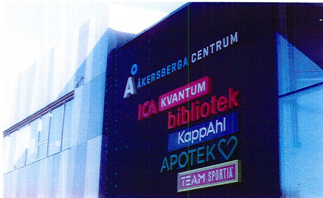
Foto skyltning på fasad Åkersberga Centrum

Tillfälliga och fritt uppsatta reklamskyltar tillåts endast undantagsvis. För mer permanent skyltning finns råd och riktlinjer att följa.