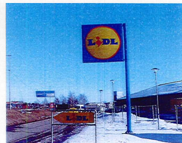
Exempel på stolpskytt

Står fritt och har sin egen bärande konstruktion. Konstruktionen bör utformas på ett sådant sätt att det förhöjer det estetiska värdet. Kan vara reklamplats för en verksamhet eller ett område och är oftast riktad mot trafikanter. Pyloner kan vara lämpliga i storskaliga miljöer som bensinmackar, industriområden eller affärscentrum. De ska i första hand placeras inom fastigheten som verksamheten tillhör.