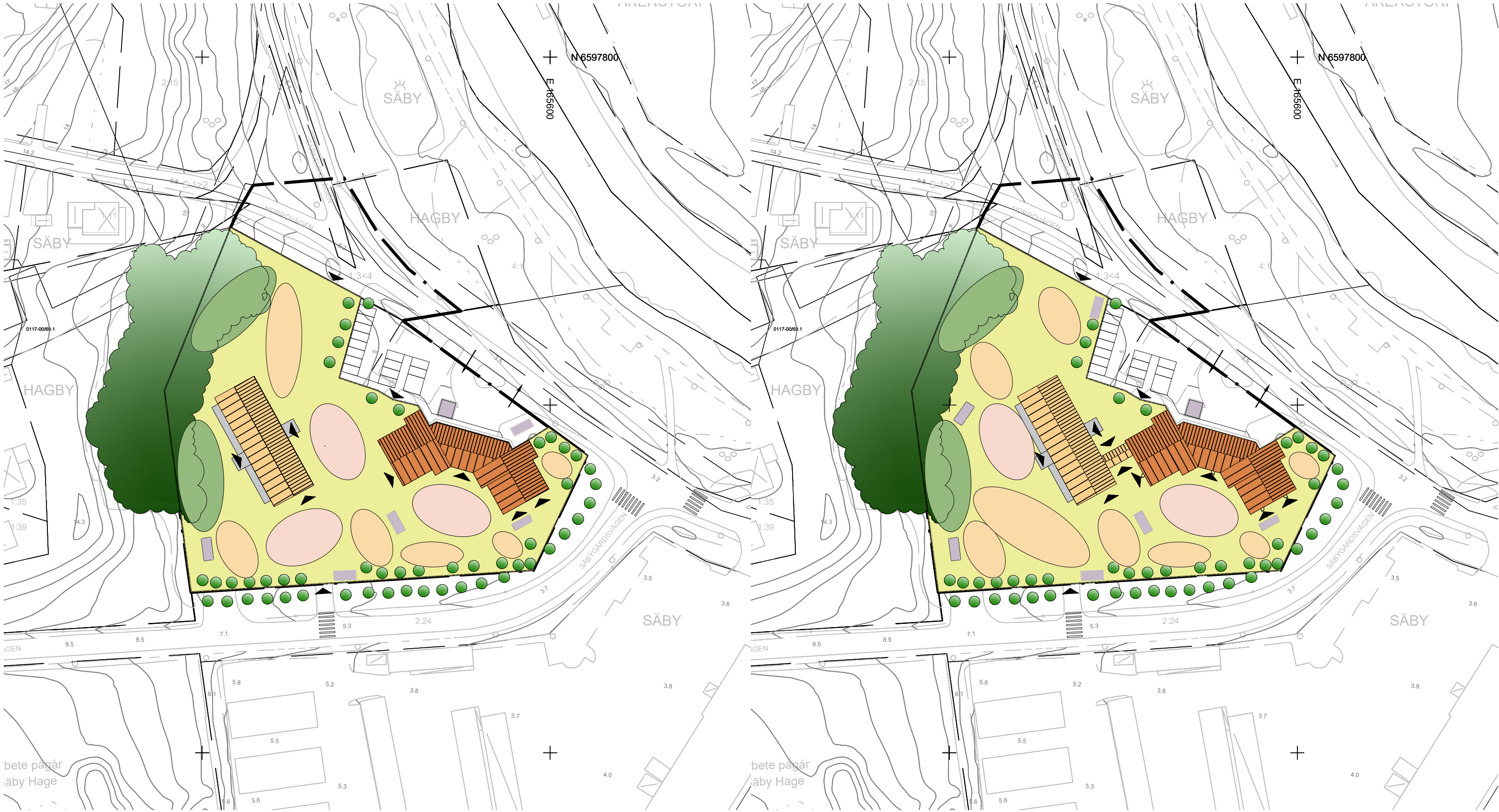
ILLUSTRATION (Illustrationen visar två förslag på placering/utformning).