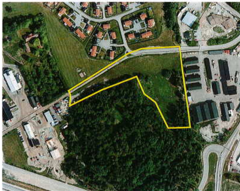
Bild 2. Planområdets ungefärliga gräns markerad med gul färg.