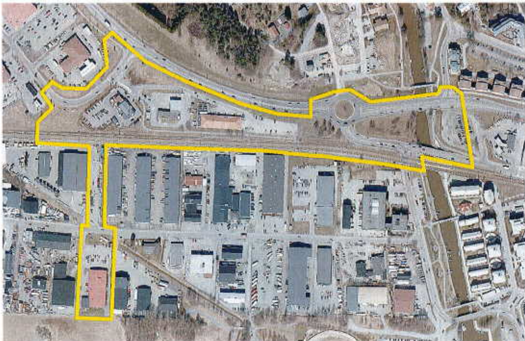
Preliminär avgränsning av planområdet.

Planområdet begränsas preliminärt av väg 276 i norr, Bergavägens förlängning i öster, Roslagsbanan i söder samt Rallarvägen i väster. Utöver detta ingår även den nya entrégatan till Kanalstaden i planområdet, som är planerad att sträcka sig från Rallarvägen rakt söderut över befintliga industrifastigheter och Sägvägen fram till Hjulvägens förlängning.