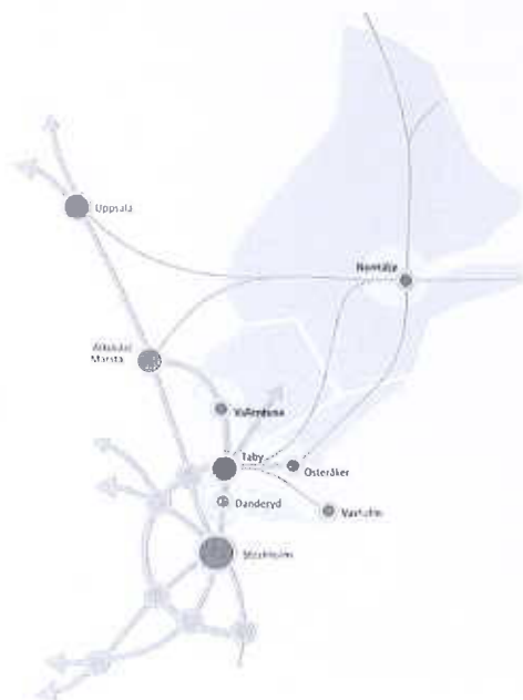
Figur: Vision Stockholm Nordost! Nordostkommunernas läge i Stockholmsregionen. Bearbetning av RUFSS 2010

Nordostkommunerna anser att RUFSS behöver kompletteras med en avgränsning av Roslagsbanan till Arlanda. En sådan utbyggnad av Roslagsbanan skulle utgöra en viktig tvärförbindelse mellan nord och nordostsektorn och mellan de regionala stadskärnorna Täby centrum - Arninge med Arlanda - Märsta och vidare mot bland annat Uppsala.