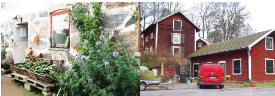
Åkersbro som målpunkt. Kanske med café, loppis och grönsaksförsäljning