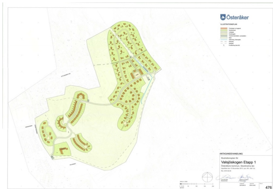
Illustrationsplan för området.