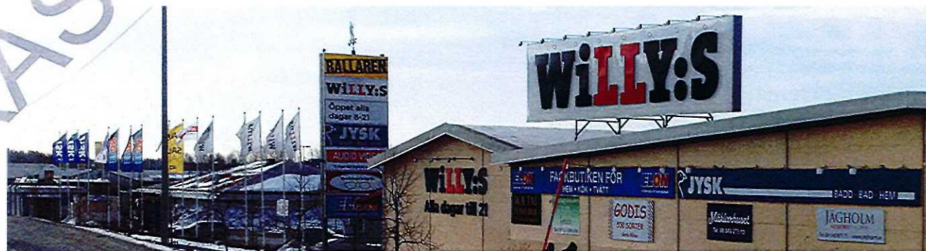
Foto inom verksamhetsområden Österåkers kommun

Verksamhetsområden tål en kraftigare skytning än andra miljöer eftersom områdena präglas av en storskalig miljö. Skytningen ska dock vara prydlig och framför allt vägledande.