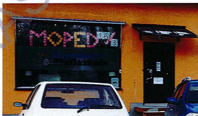
Exempel på foliering av fönster