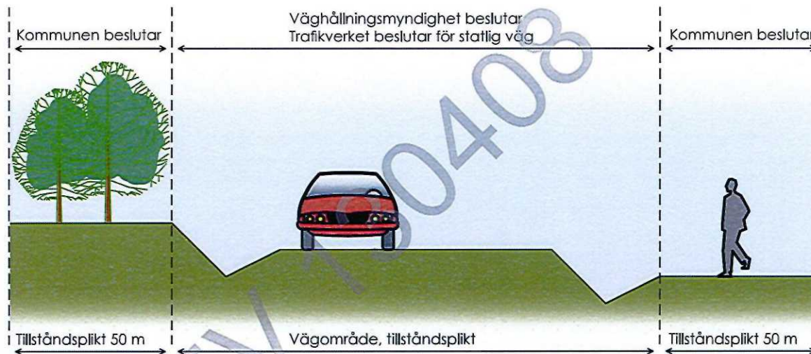
Illustration inom detaljplanerat område

För skyltplacering inom 50 m från väg- område, söks tillstånd hos Länsstyrelsen.