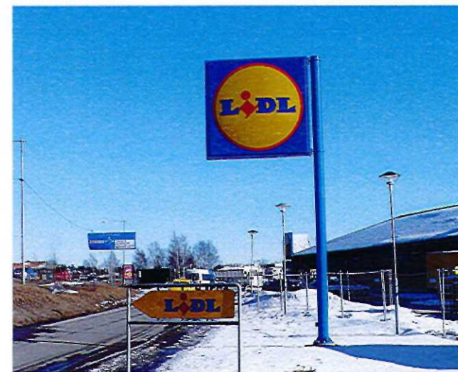
Exempel på stolpskyt

är en mängd skyltar som innehåller löpsedlar, varureklam och annan information och kan ge ett skräpigt intryck. Genom bygglov blir reklamfält specificerade till storlek och material så att skyltningen blir anpassad till stadsbilden och byggnaden.