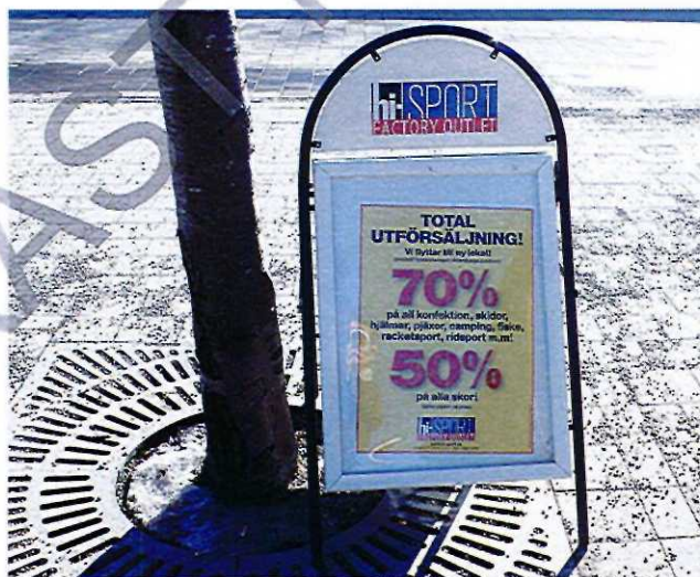
Exempel på vippskyt

s.k. trottoarpratare är utplacerad på trottoarer eller torg, med syfte att framföra butiks- eller restaurangreklam. Den allmänna tillgängligheten kan störas då denna typ av skylt ofta orsakar problem för synskadade och andra funktionshindrade samt för renhållningsfordon. Vippskyt får endast placeras i direkt anslutning till verksamheten och ska plockas bort över natten och kräver markägarens tillstånd.