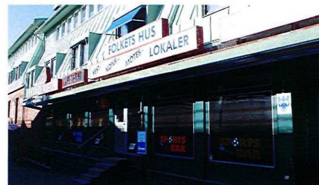
Exempel på skytllåda