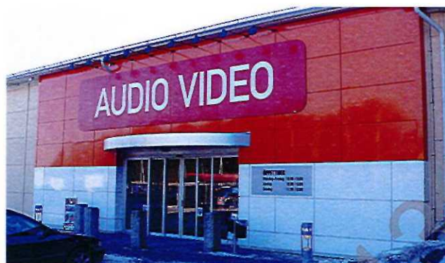
Exempel på skivskylt

Vanlig som butik- och verksamhetsreklam. Dioder har god ljusstyrka trots små dimensioner och gör dem speciellt lämpliga vid framställning av komplicerade varumärkesskyltar.