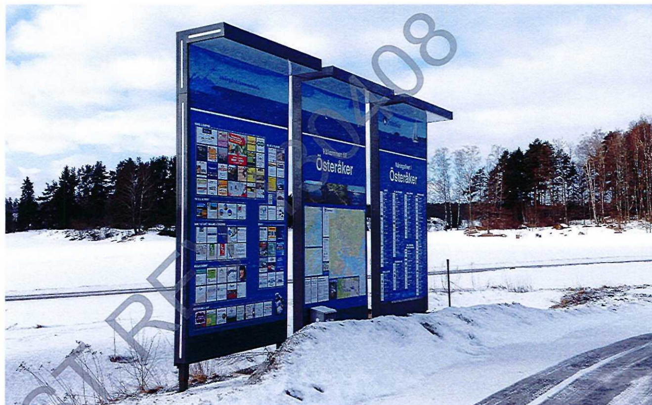
Foto informationsskylt Österåkers kommun

Att skyltar placeras i exponerade lägen kan vara en förutsättning för detta och genom tillämpning av skyltpolicyns riktlinjer ska företag