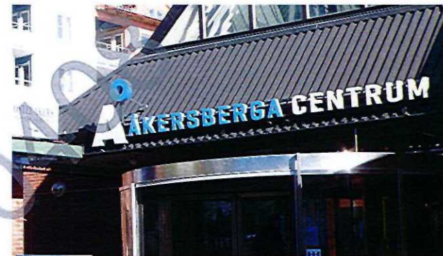
Exempel på friliggande bokstäver

Liknar planskylden men är en låda, med inbyggd armatur. Den är svår att anpassa till byggnadernas arkitektur och är lämplig i storskaliga miljöer. Stora lysande ytor bör undvikas och det är texten som ska vara lysande och inte bakgrunden. Karaktären av låda förstärks av ljus bakgrund och skytllådor för lysrör godkänns bara i handels- och industriområden.