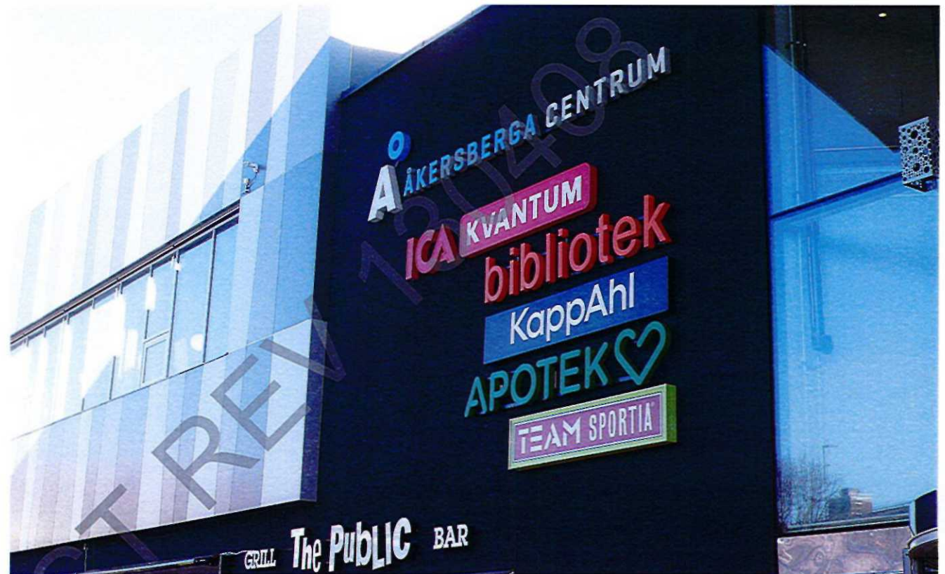
Foto skyltning på fasad Åkersberga Centrum

Omfattar skyltning av verksamhet som omsätter pengar och vars avsikt är att ge intäkter.