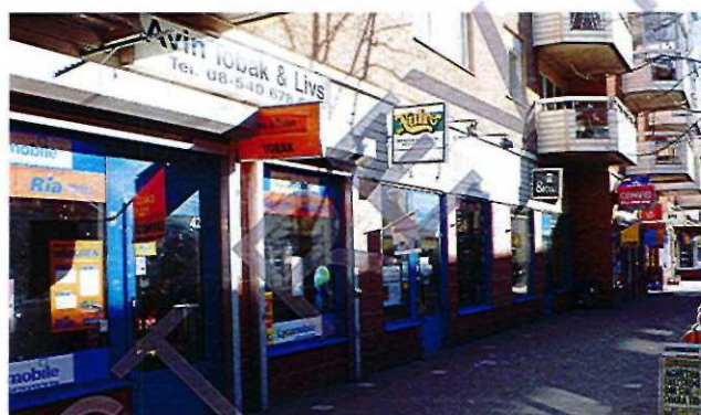
Exempel på utstående skylt