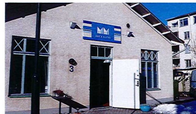
Exempel på planskyt