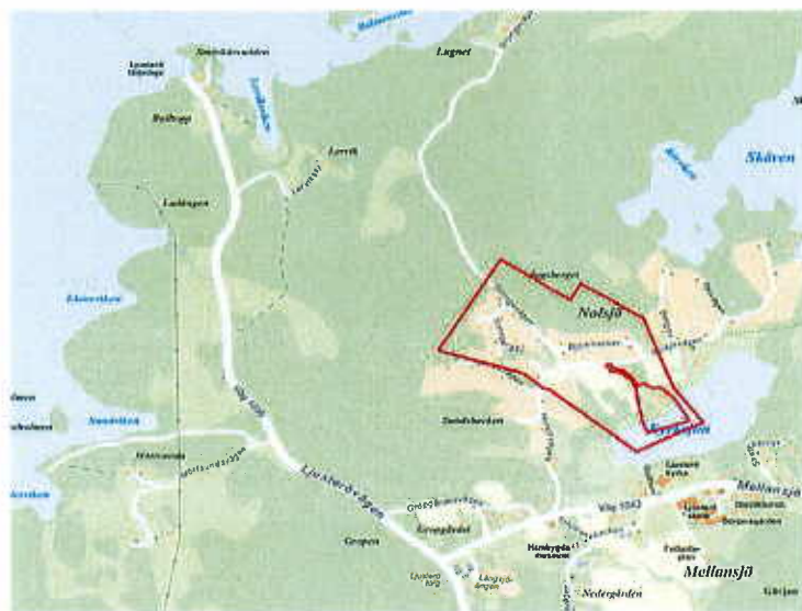
Översiktskarta med preliminär planavgränsning markerat i rött

Nolsjö är beläget norr om Kyrksjön på norra delen av Ljusterö. Avståndet till Ljusterö torg är ca 1 km och till Ljusterö färjeläge ca 3,5 km. Området består av fritidshusbebyggelse där omvandlingen till permanentboende pågår. Inom planområdet finns 41 bostadsfastigheter, samtliga i privat ägo. Naturmarken i området ägs delvis av Österåkers kommun (Nolsjö 1:95). Resterande fastigheter (Nolsjö 1:4 och 1:6) är i privat ägo.