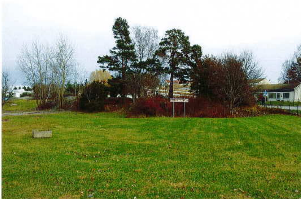
Planområdet sett från söder