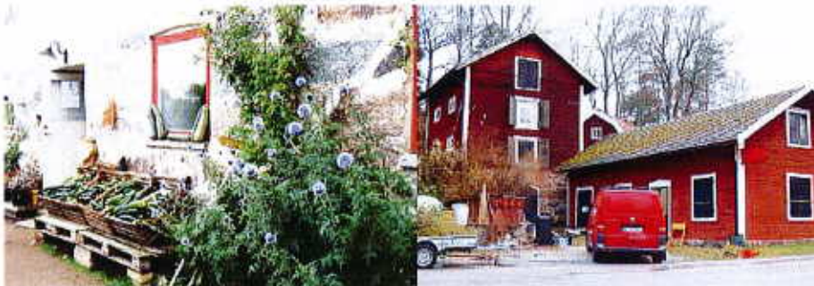
Åkersbro som målpunkt. Kanske med café, loppis och grönsaksförsäljning