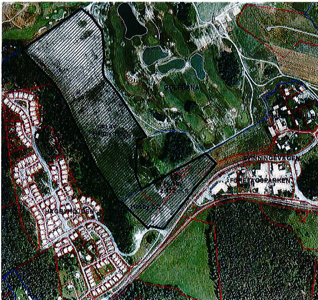
Flygfoto med planområdets preliminära avgränsning markerat med svart

IBRO Projekt AB har önskemål om att ändra detaljplanen för att möjliggöra uppförande av bostäder i form av flerbostadshus på delen närmast Svinningevägen som i dagsläget är planlagt för kontor och handel.