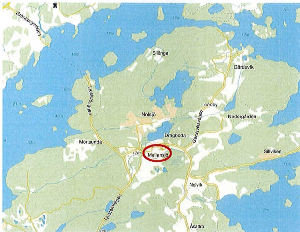
Orienteringskarta över Mellansjö på Ljusterön.