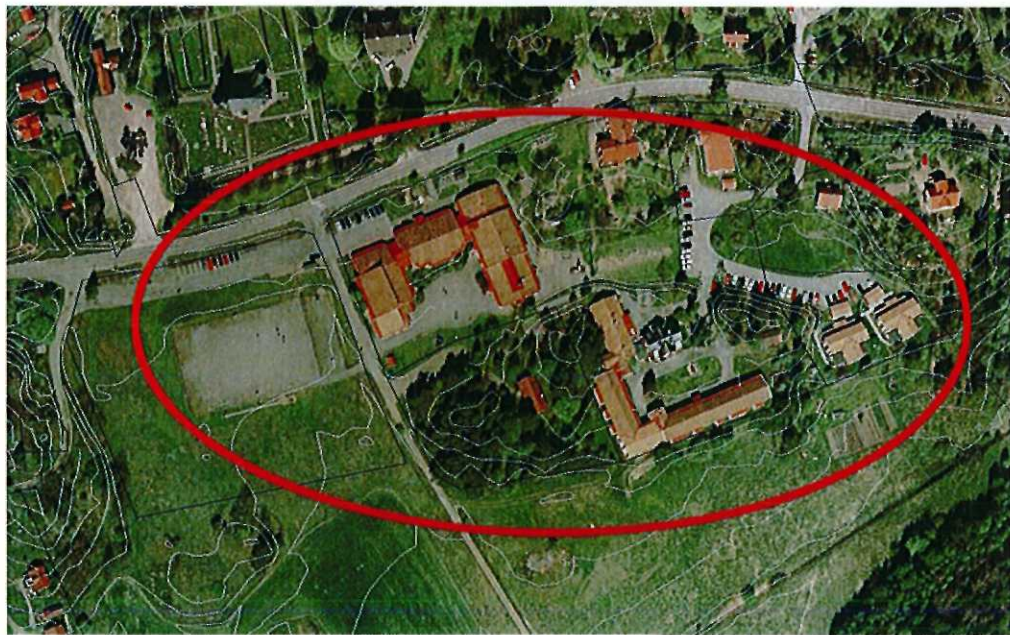
Ortofoto över området. Ungefärlig utsträckning av berörda områden i den gällande planen.