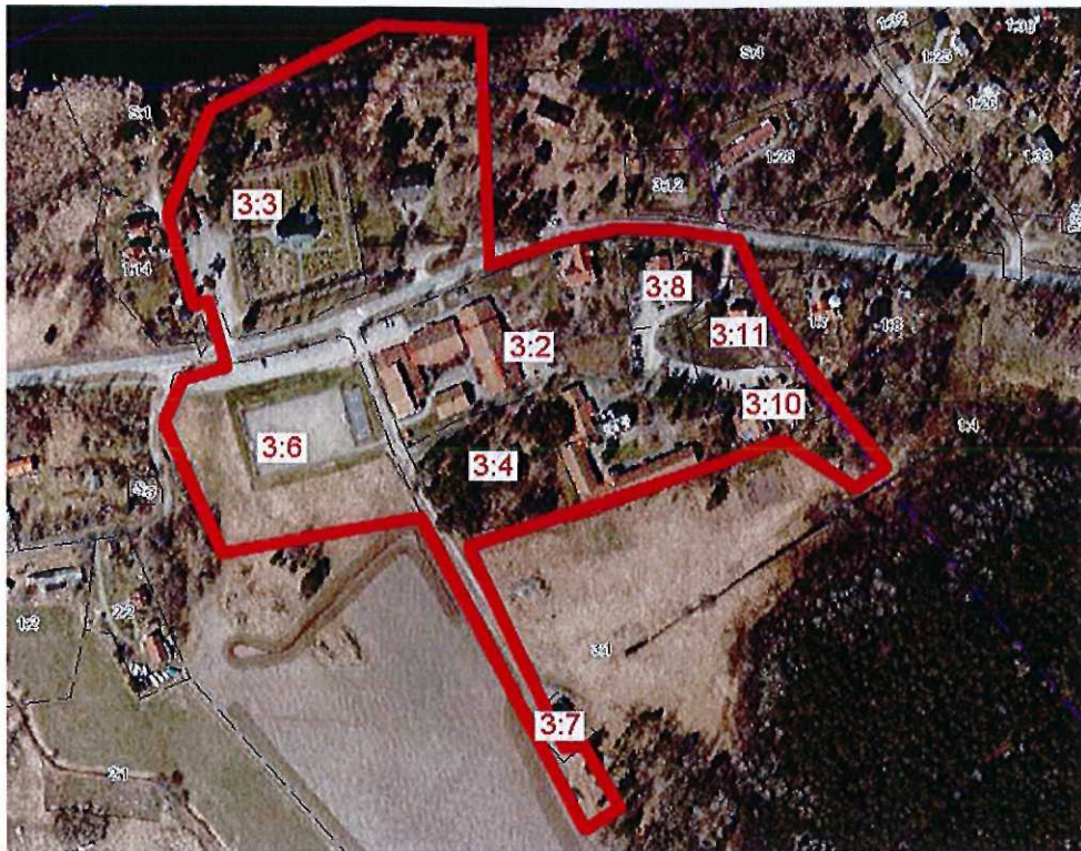
Bilden visar plangränser och fastighetsbeteckningar för gällande detaljplan Mellansjö 3:1, 3:2 m.fl.